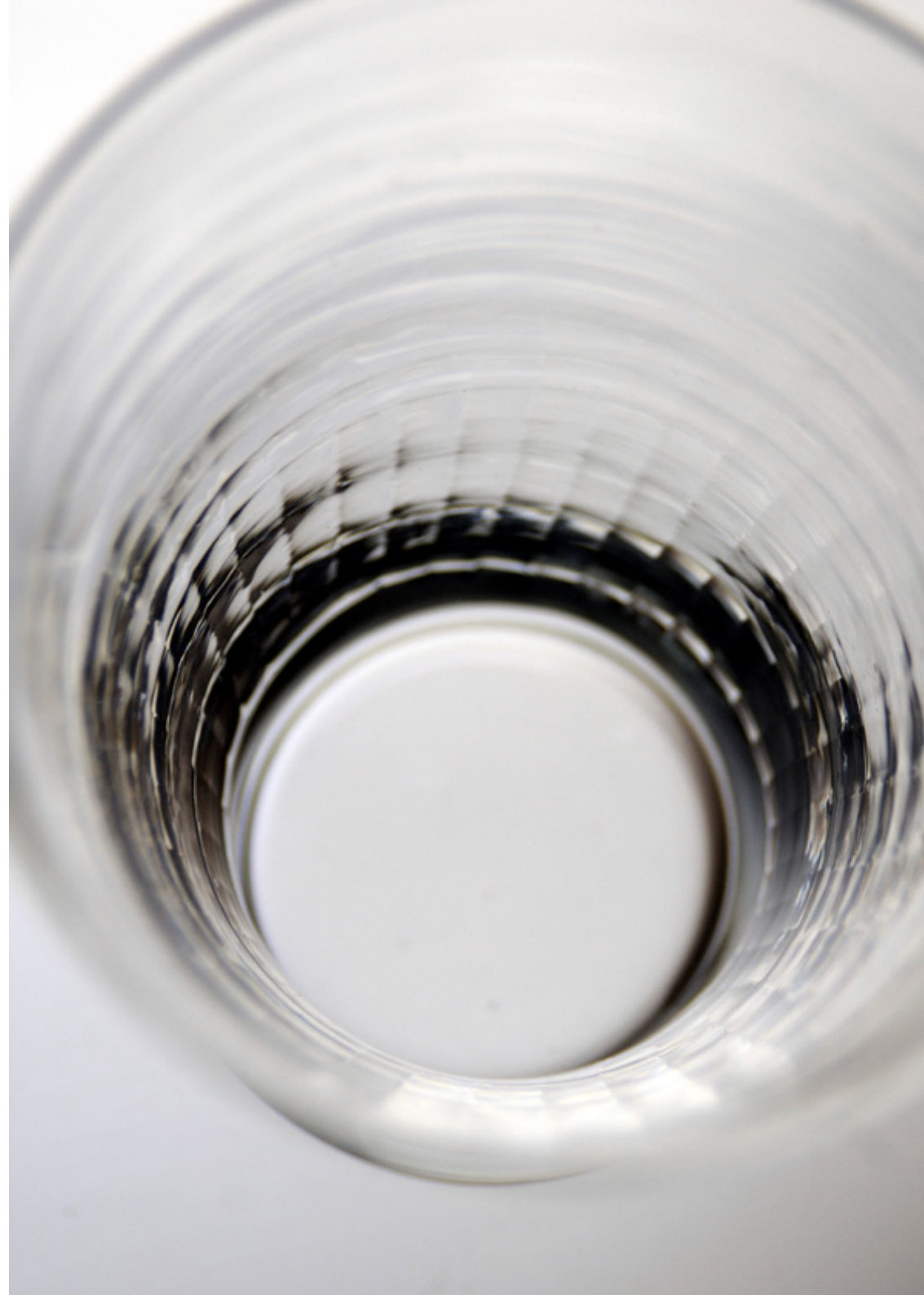
G 9 ハイボールグラス