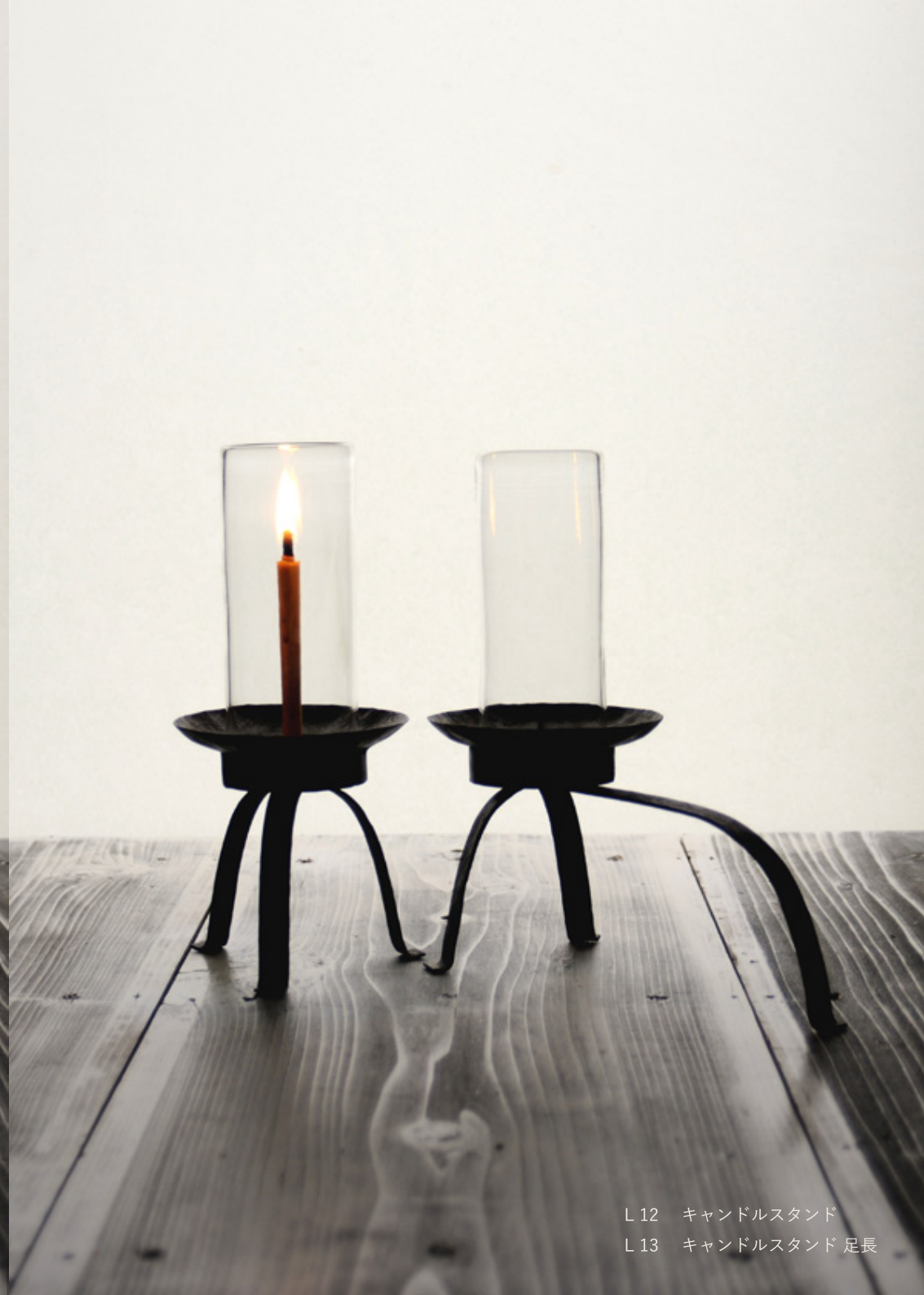
L 12 キャンドルスタンド L 13 キャンドルスタンド 足長