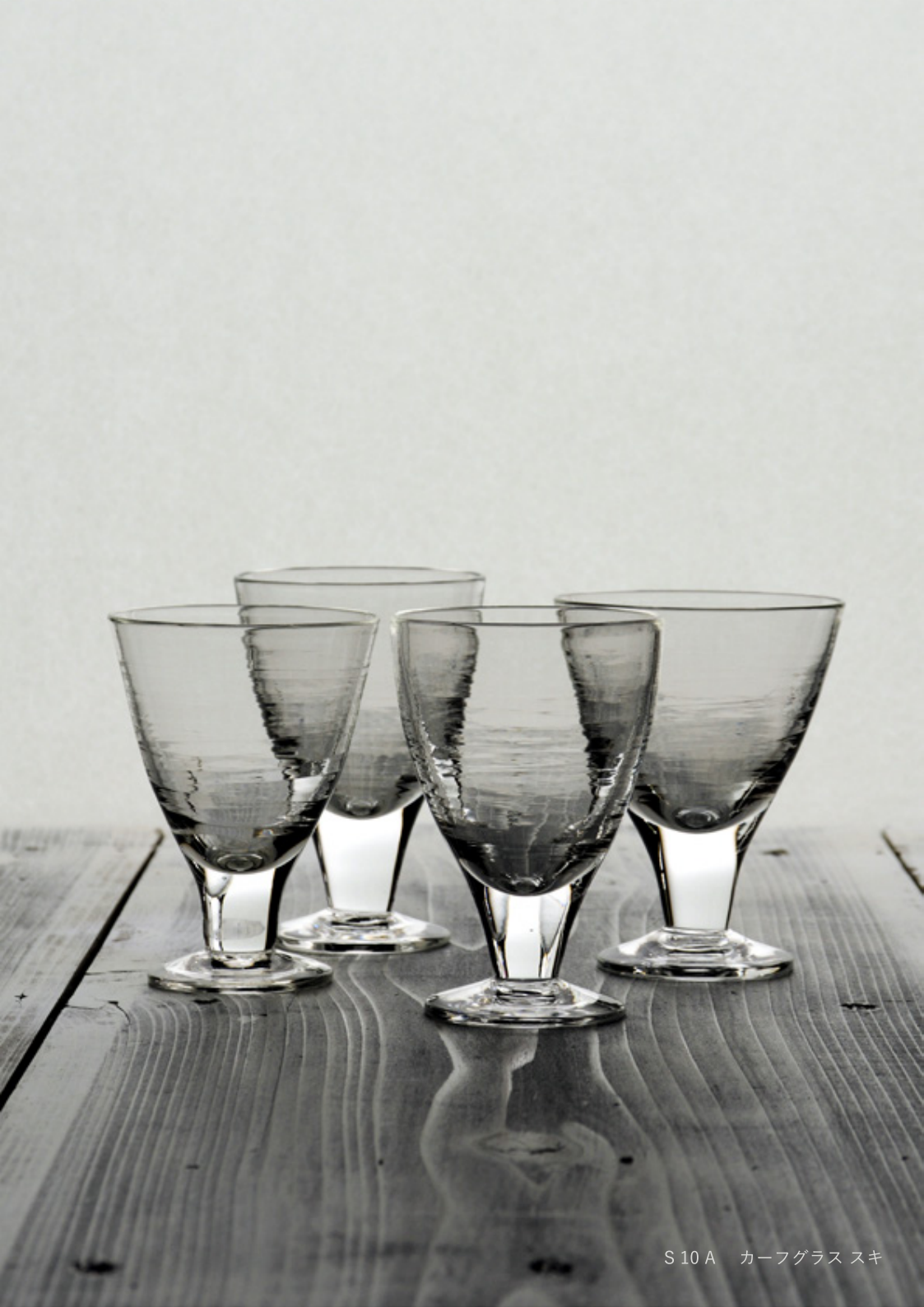
S 10 A カーフグラス スキ