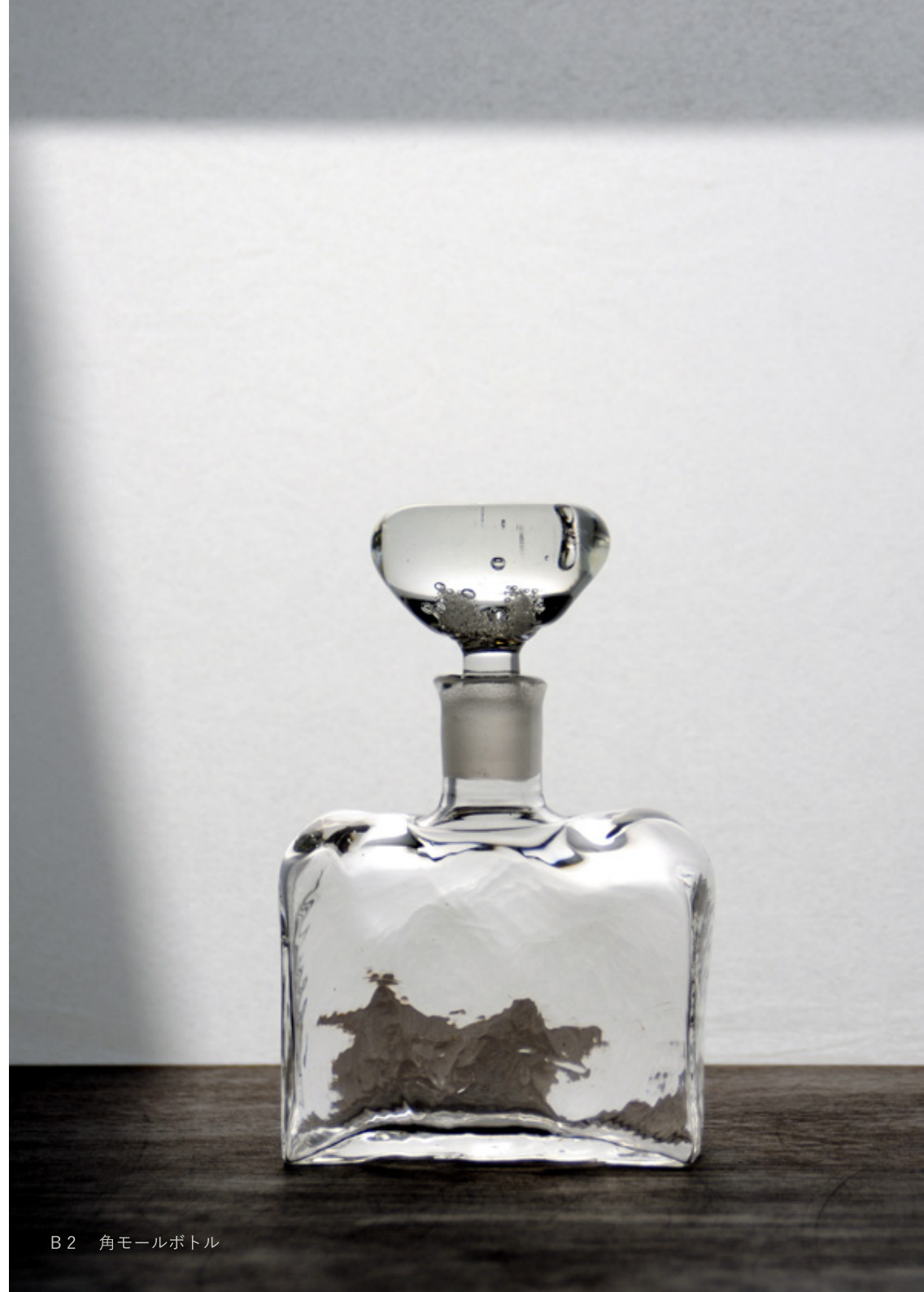
B 2 角モールボトル