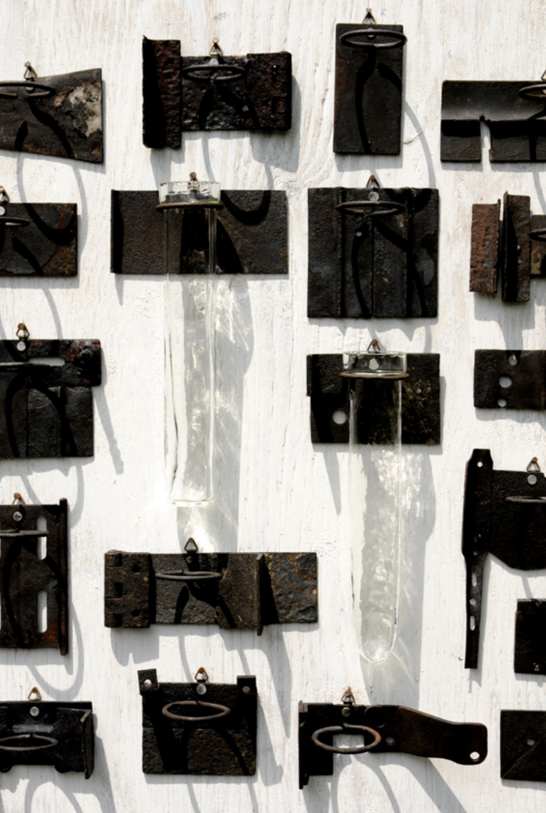
F 17 掛け花