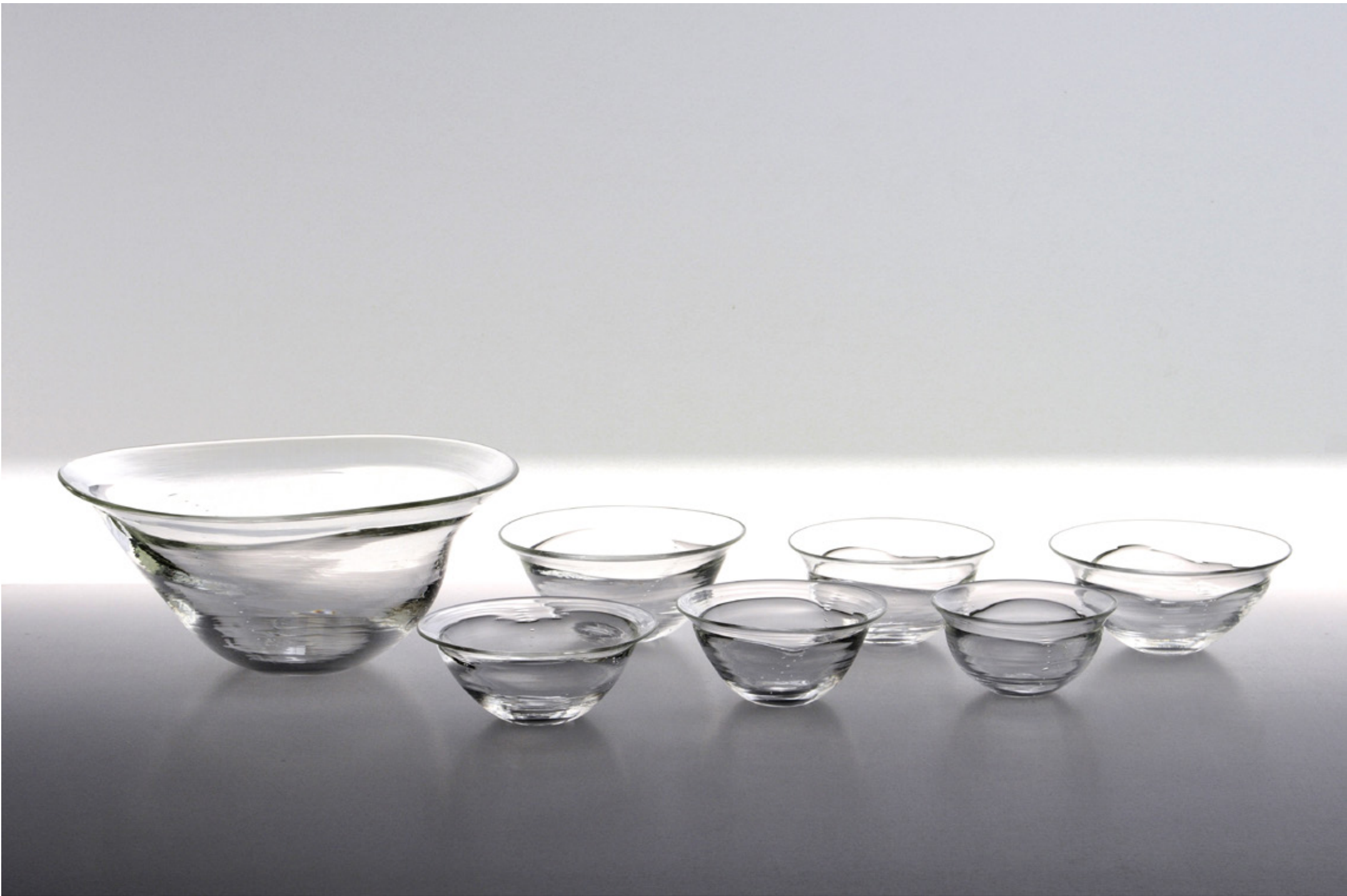
H 6 ディップボウル C 8 ディップ小鉢