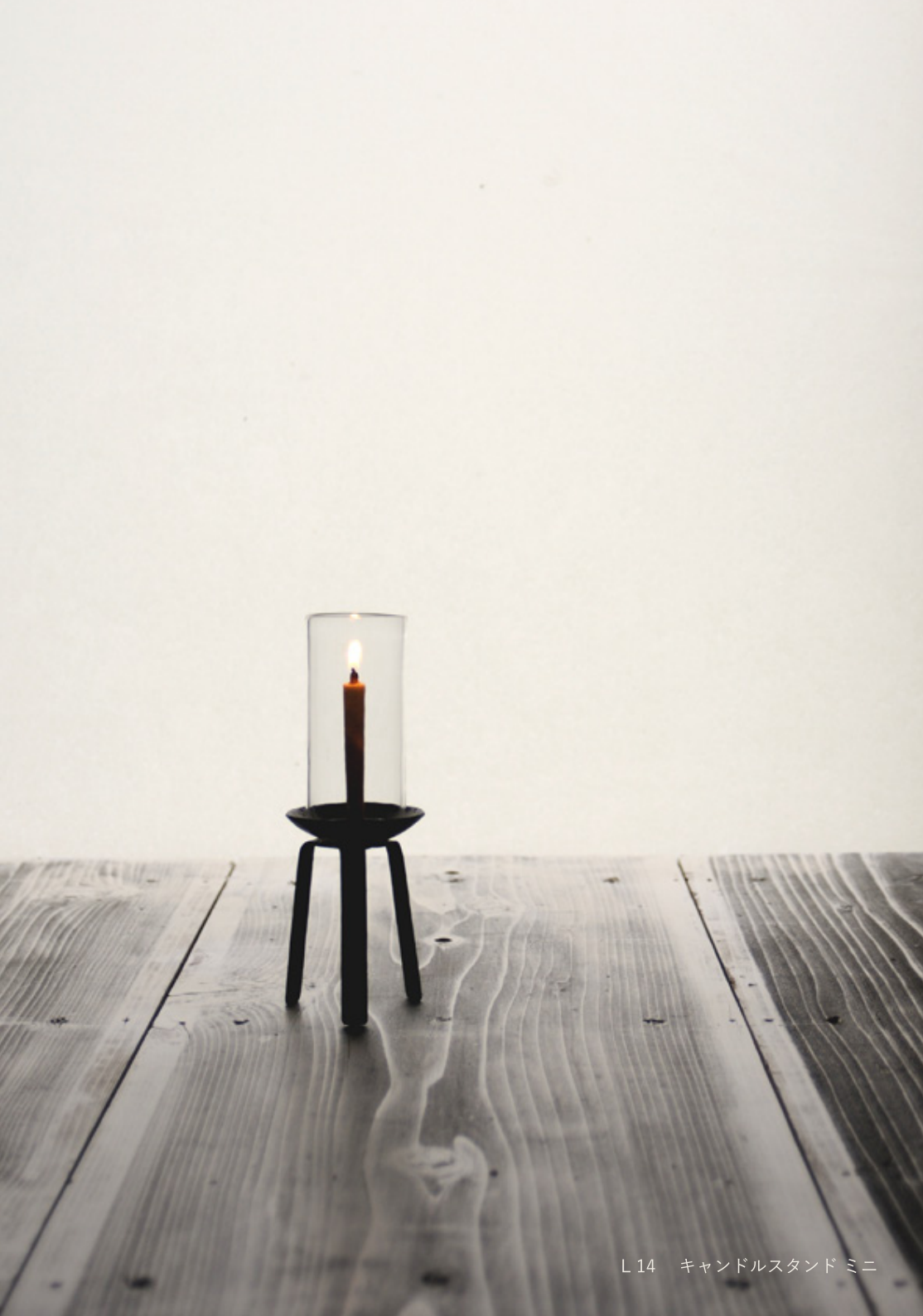
L 14 キャンドルスタンド ミニ