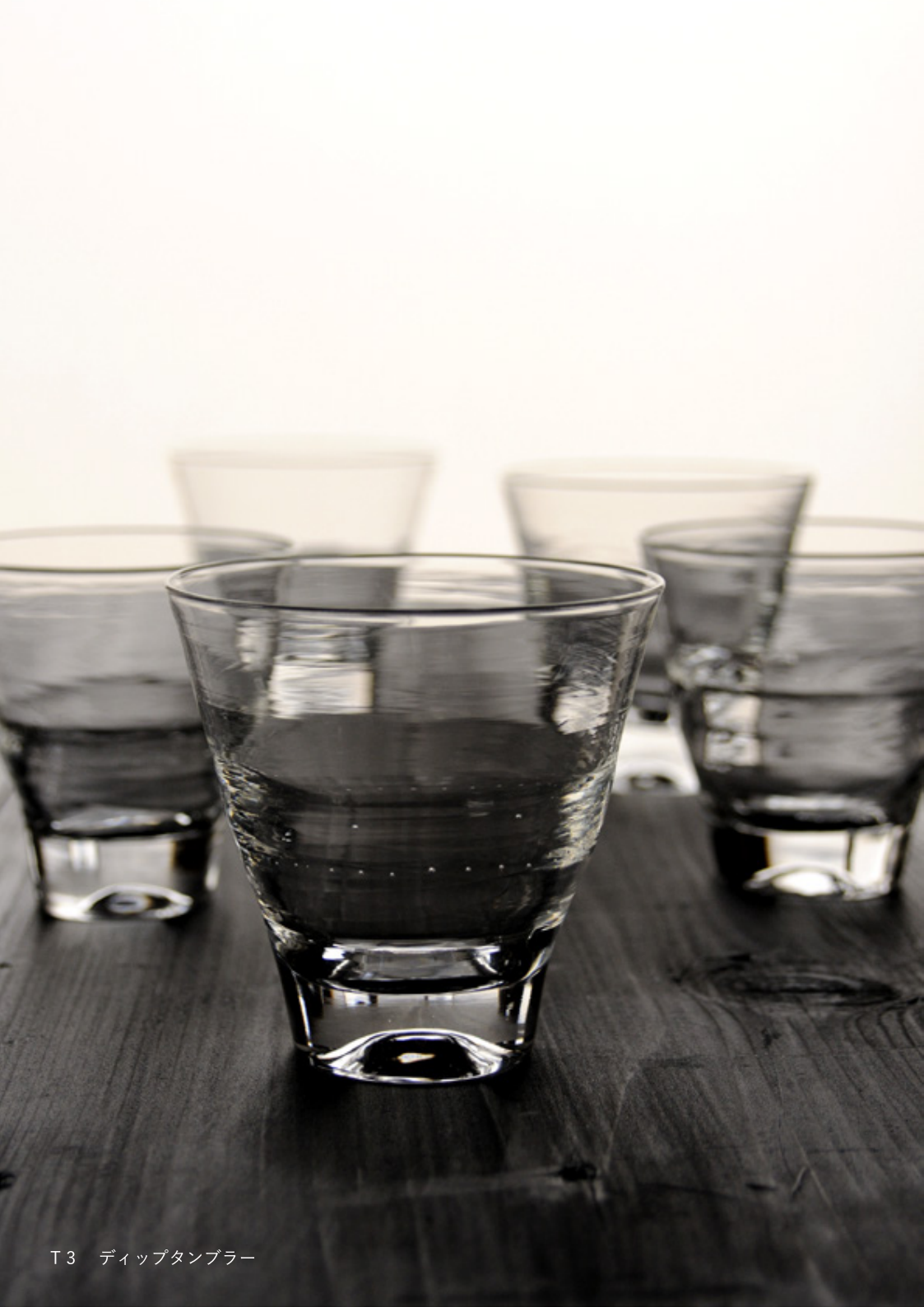
T3 ディップタンブラー