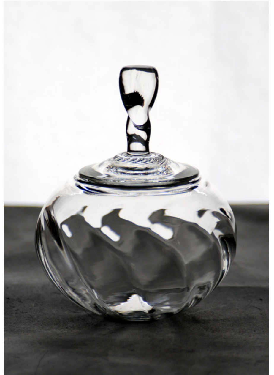
B10 ポット B10 ポット