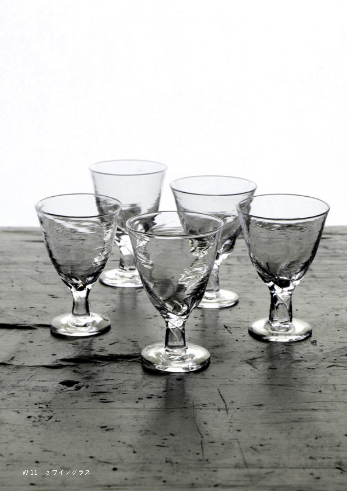
W11 a ワイングラス