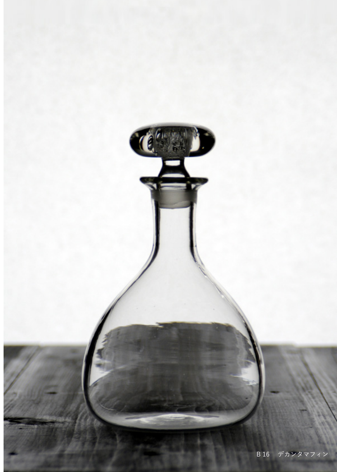
B16 デカンタマフィン