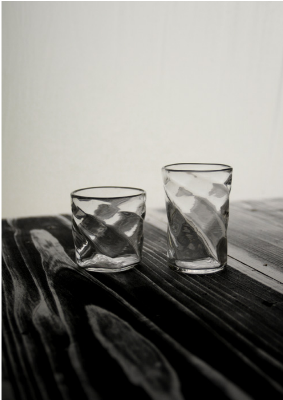
G 1 5モールグラス