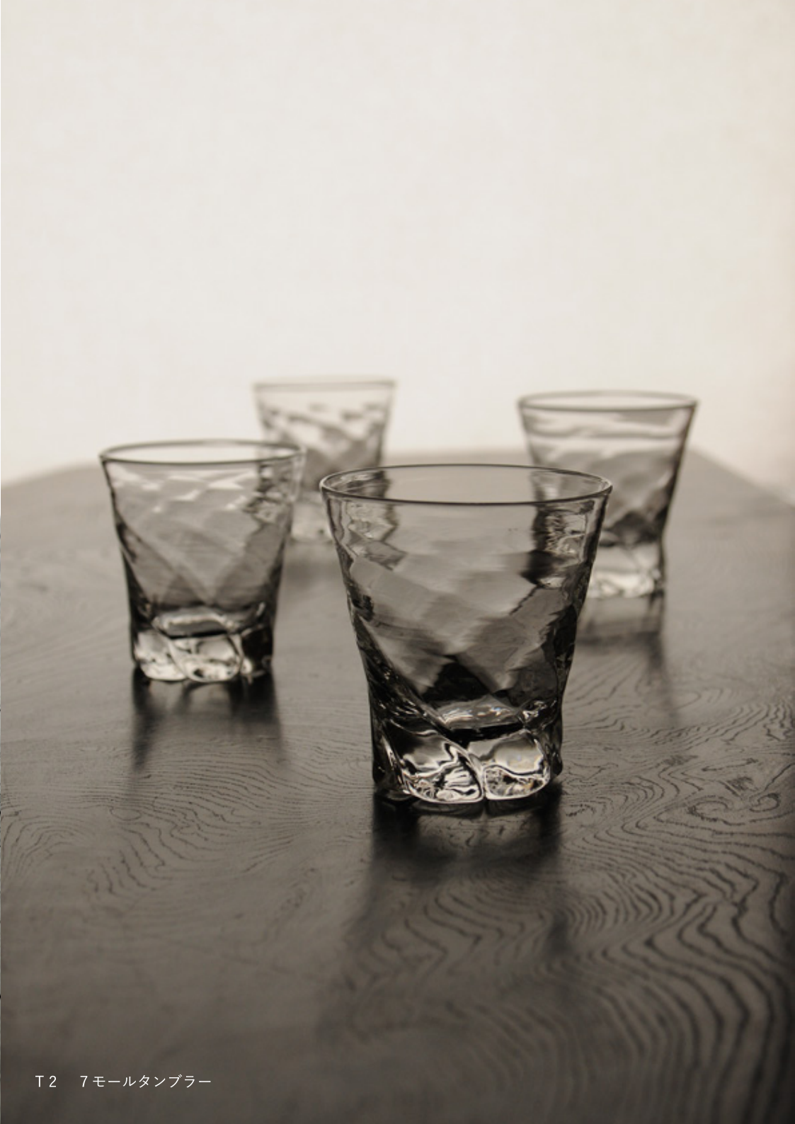
T2 7 モールタンブラー