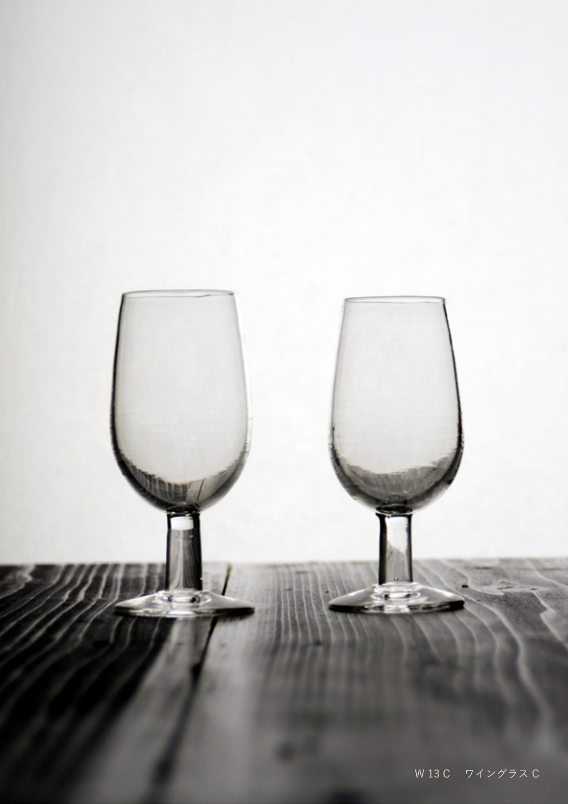
W 13 C ワイングラス C