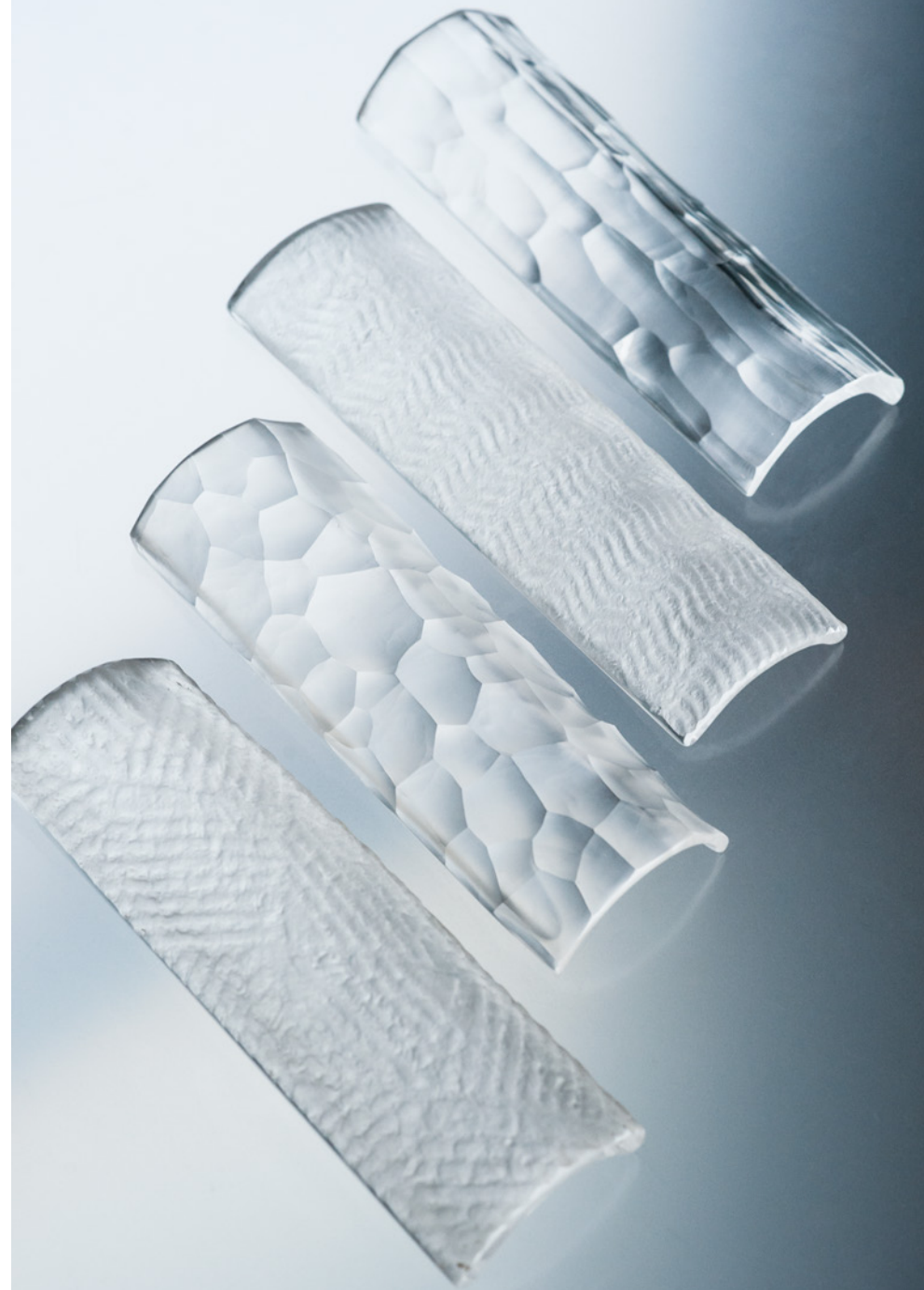
O 32 茶則