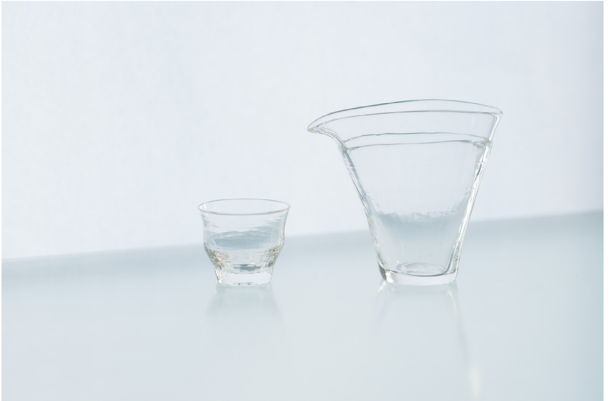
S 2 0 B ホウ珪酸茶盃 クリア