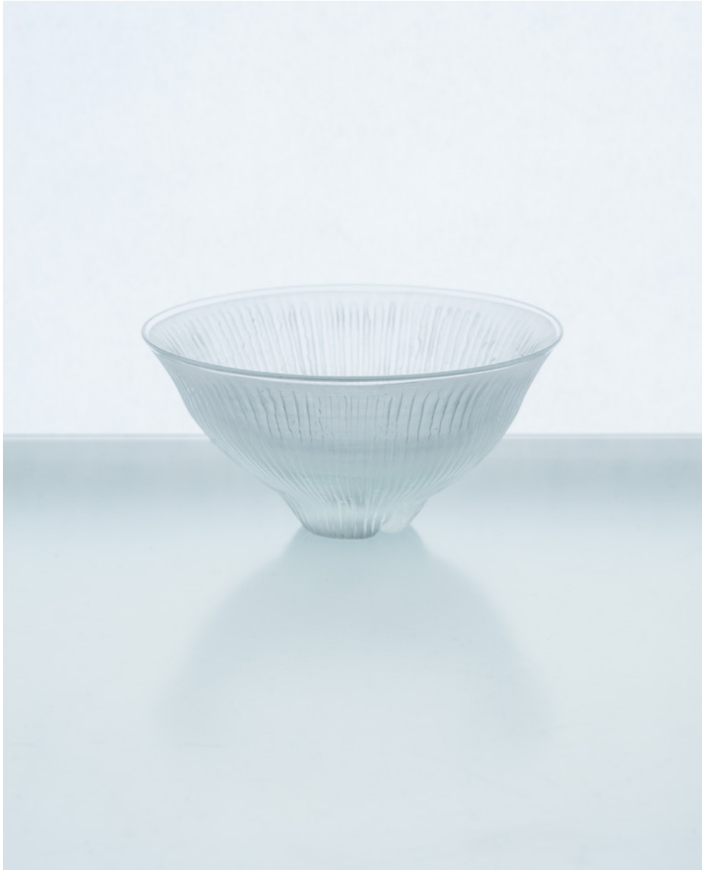
H 36 ホウ珪酸線刻茶碗 スキ