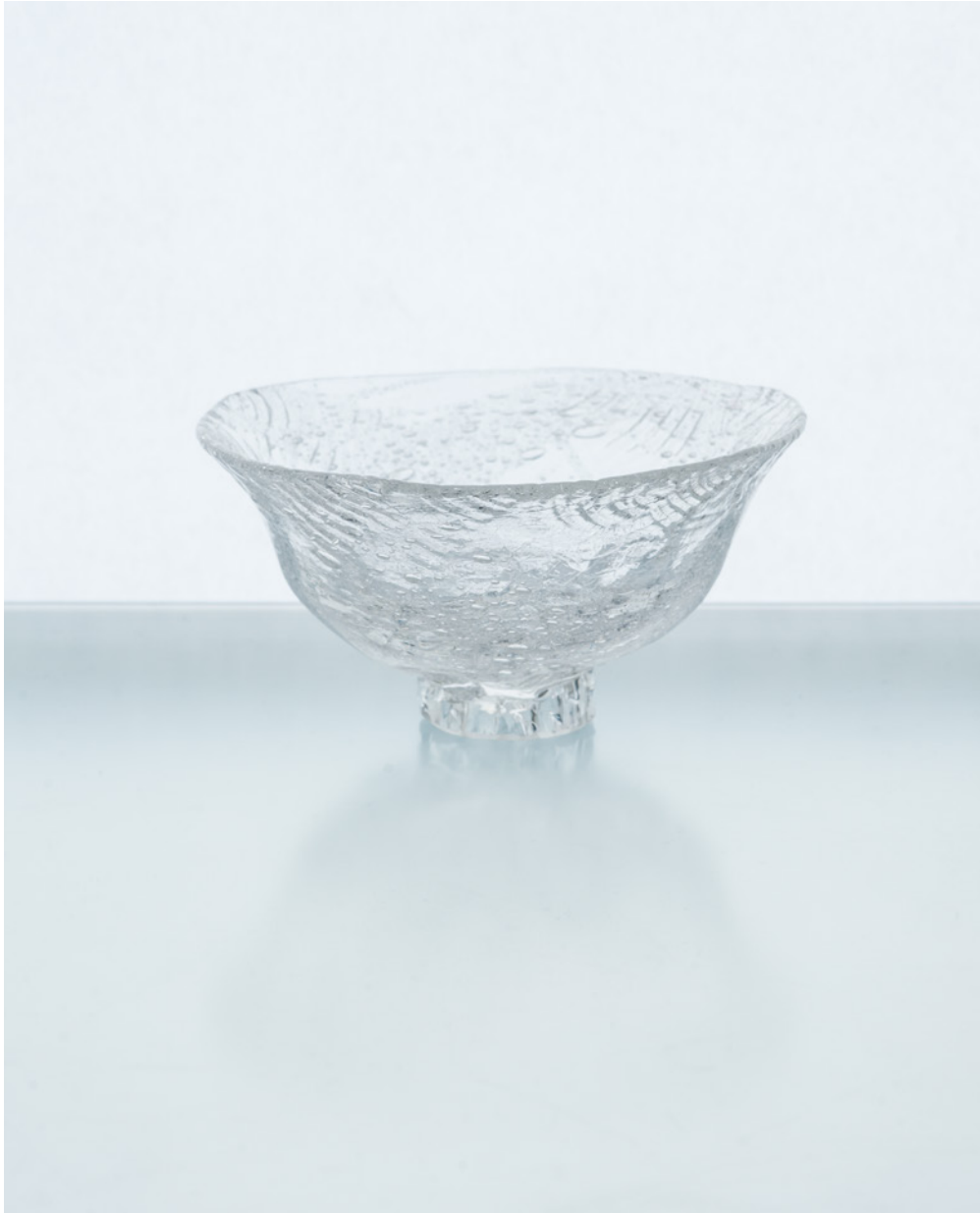
H 30 夏茶碗