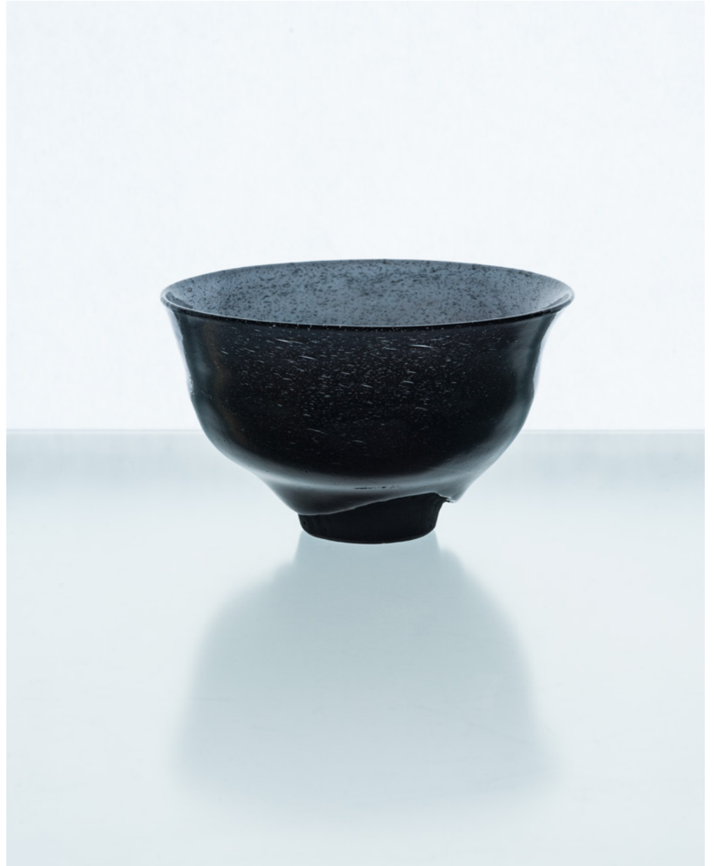
H 36 ホウ珪酸釉薬茶碗