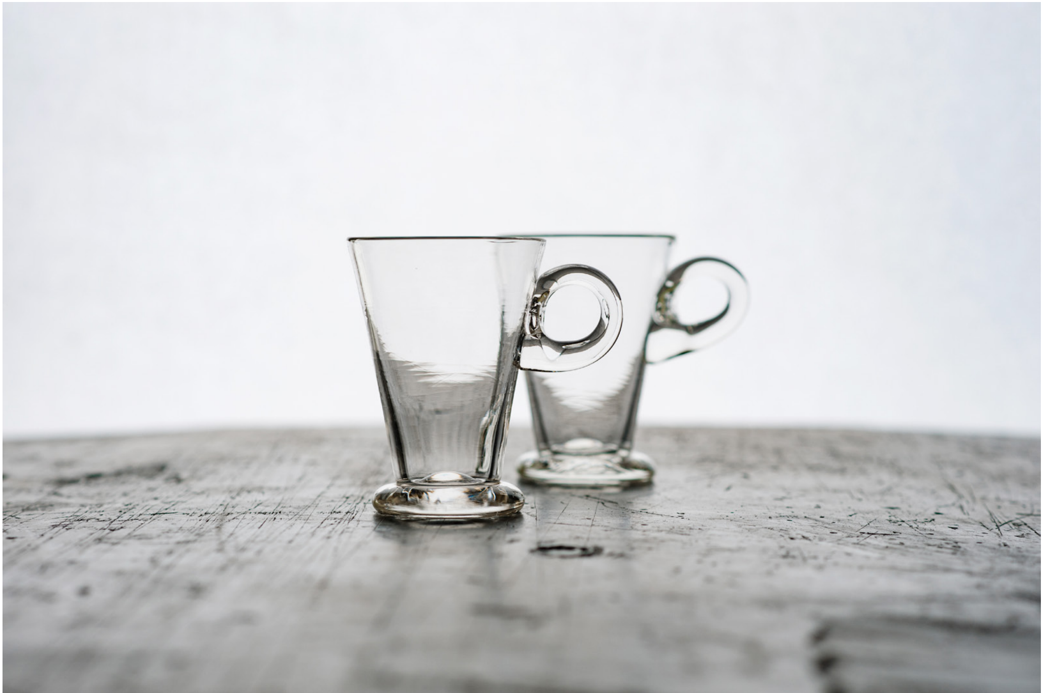
G 14 ホウ珪酸マグカップ