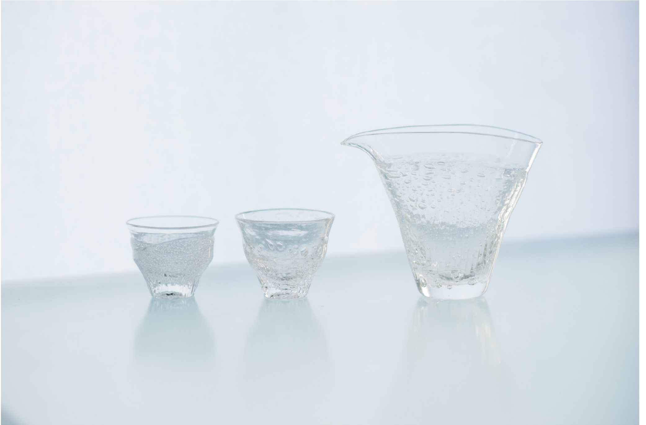
S 20 C ホウ珪酸茶盃 アフ