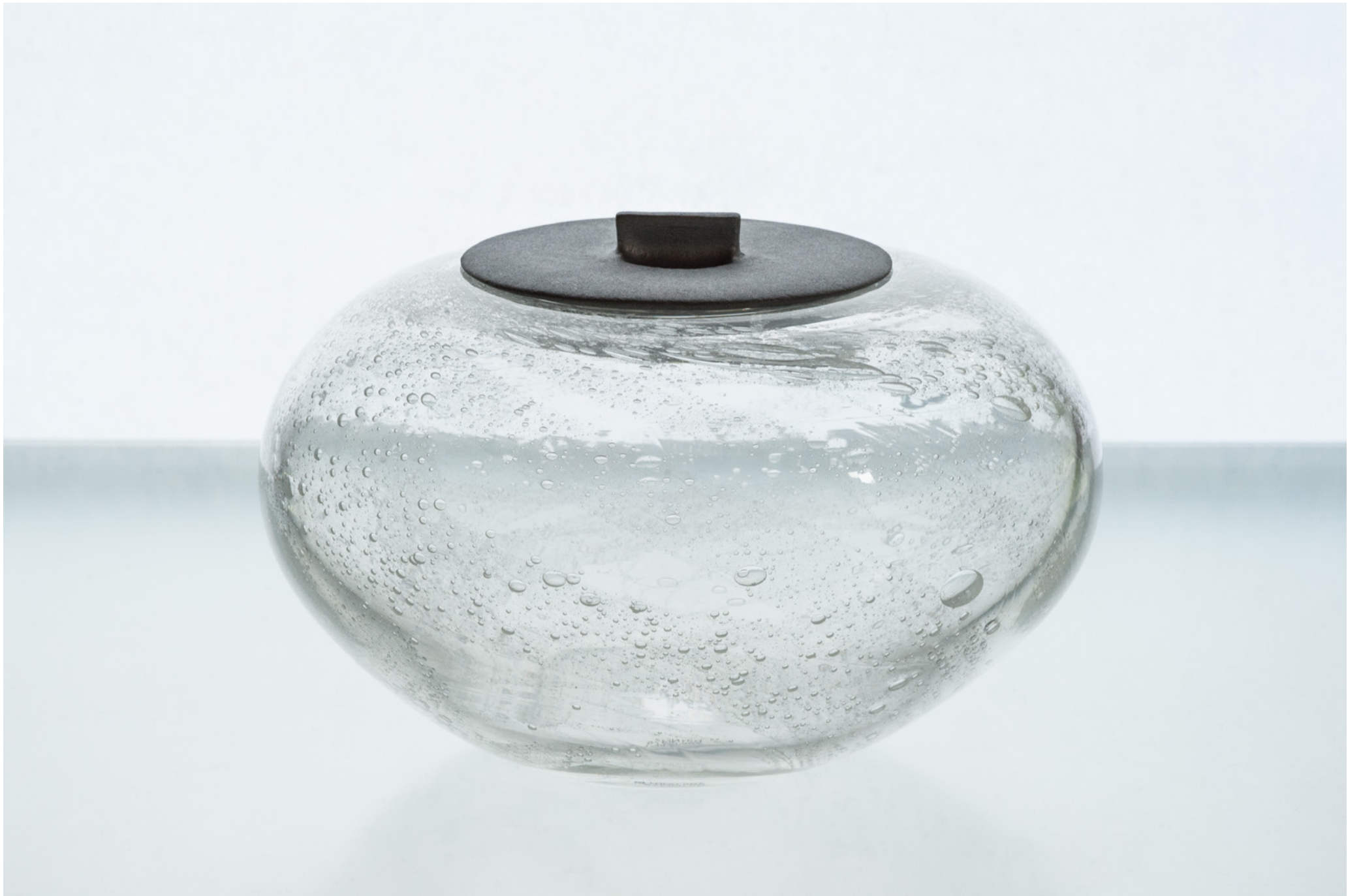
B 25 水指し マユ型