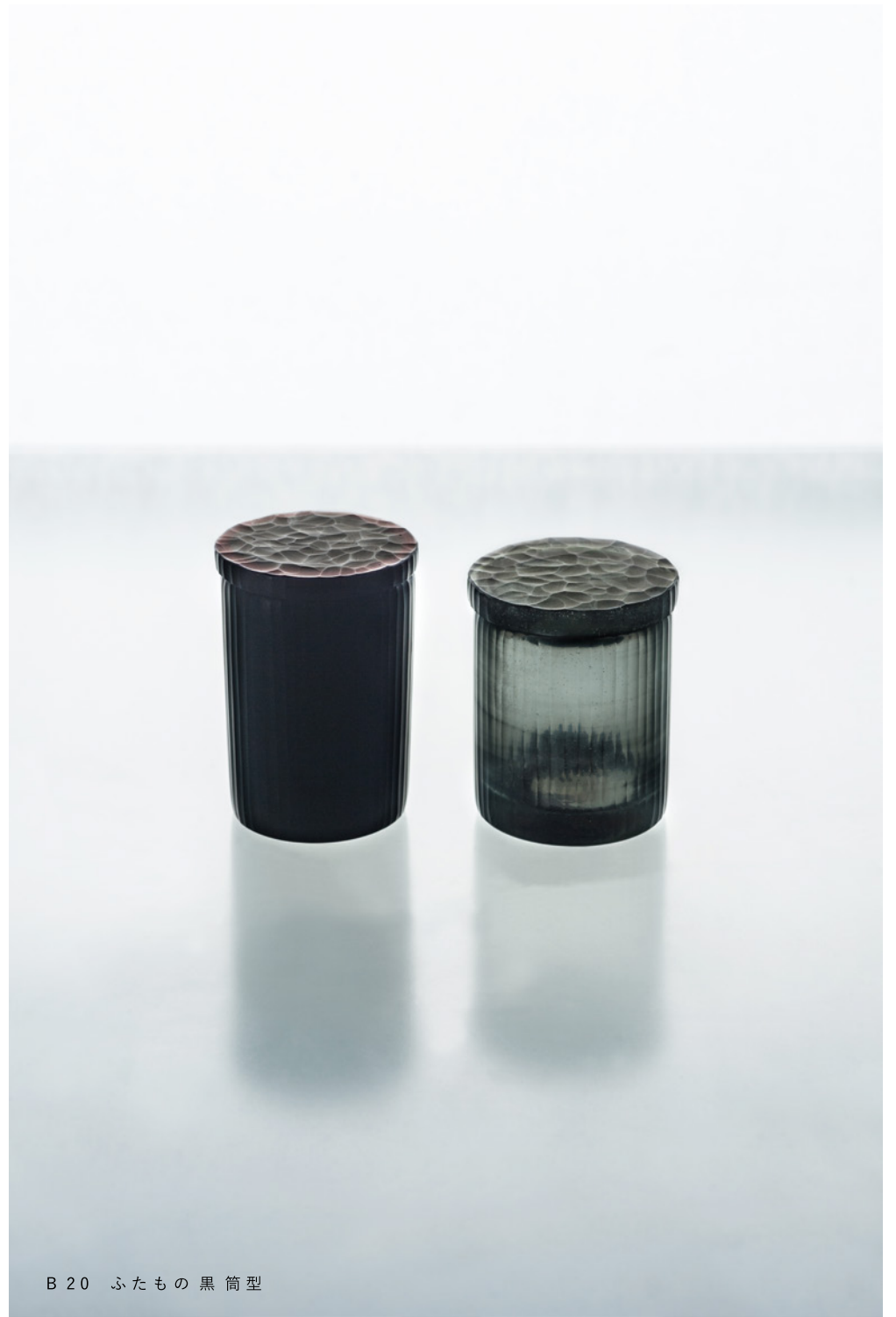
B 20 ふたもの黒筒型