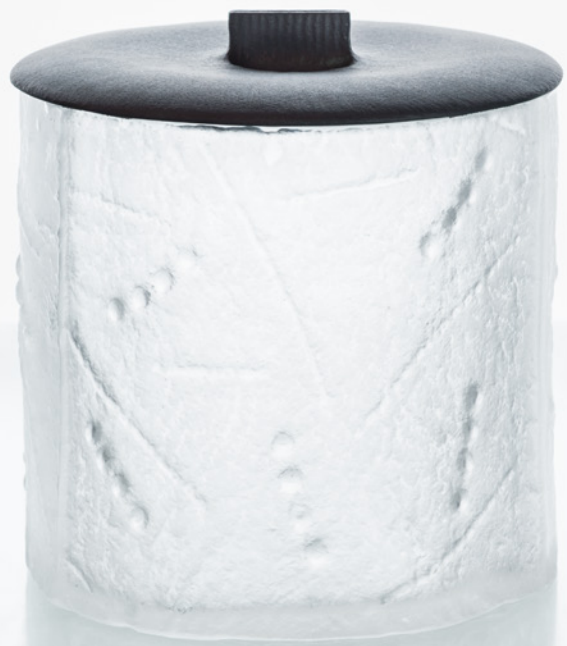
B 25 水指し スキ