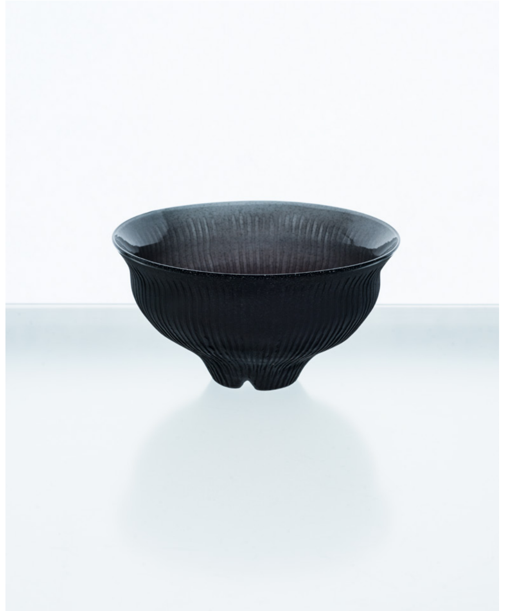
H 36 ホウ珪酸線刻茶碗 黒