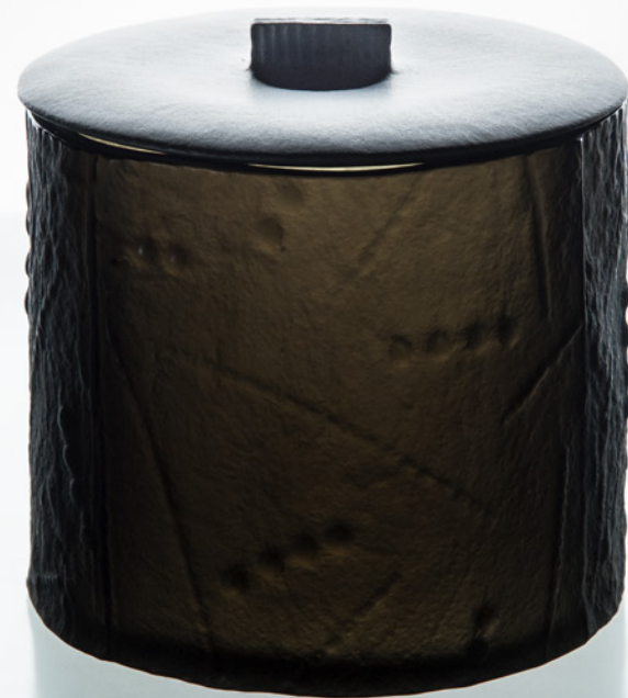
B 25 水指し 黒