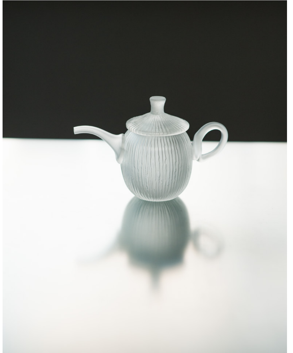
H 4 6 茶壺 線刻