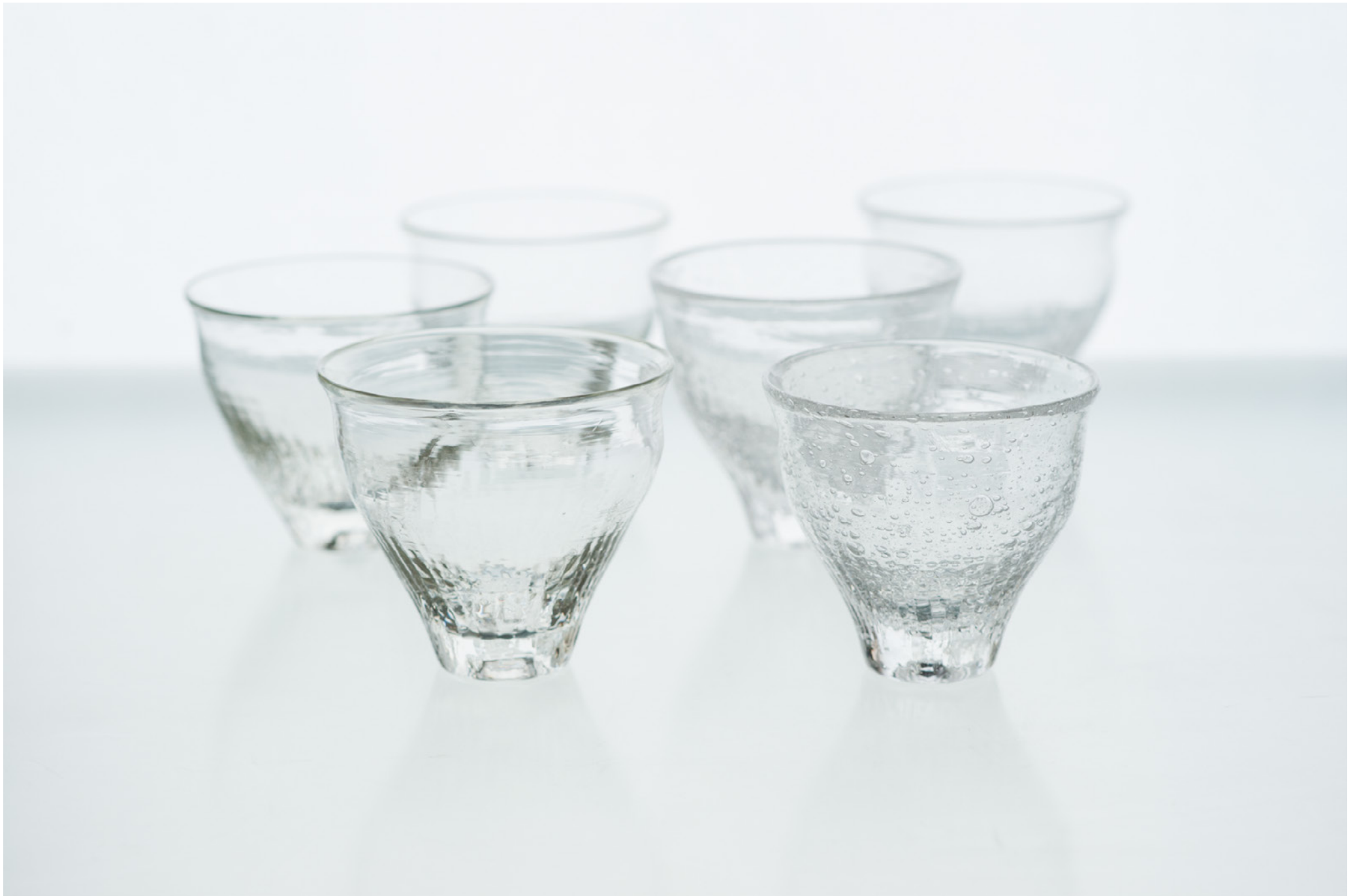
C 16 A ホウ珪酸 カフェオレポウル クリア