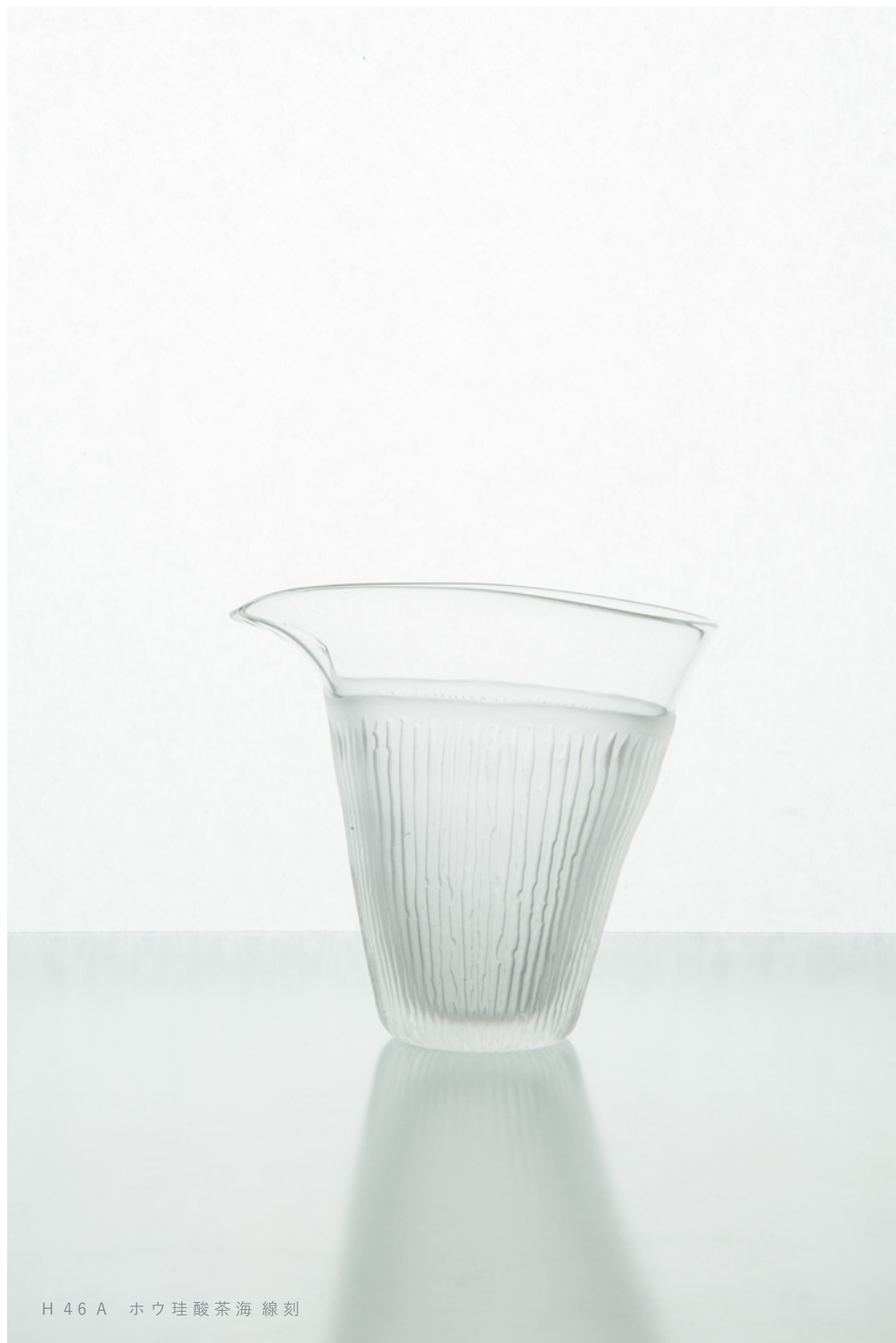
H 4 6 A ホウ珪酸茶海 線刻