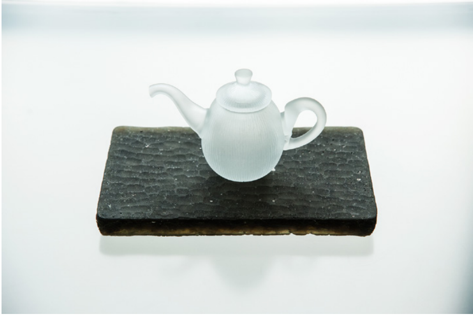
P 19 茶盤