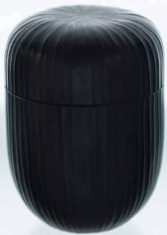
B 24 ふたもの黒棗型