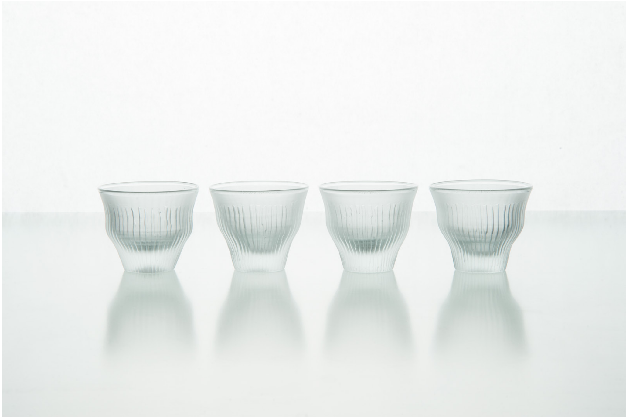
S 20 A ホウ珪酸茶盃 線刻